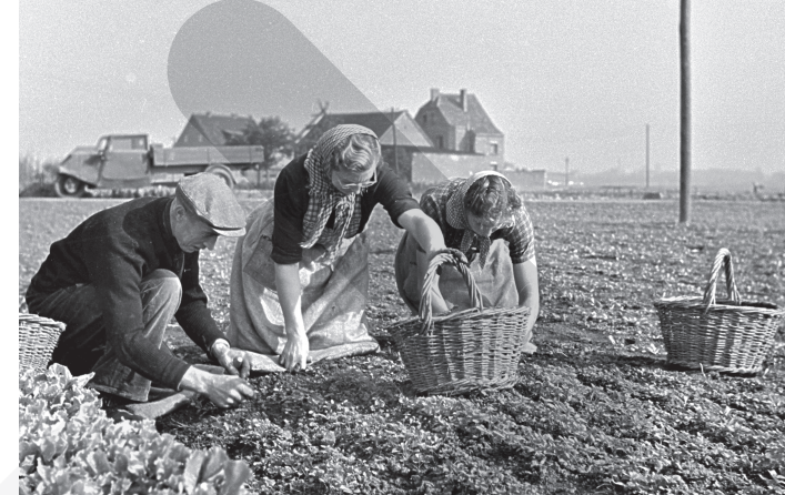
Feldarbeit in Kappes-Hamm, Düsseldorf, ca. 1950

Menschen, People, Leute in der rheinischen Fotografie