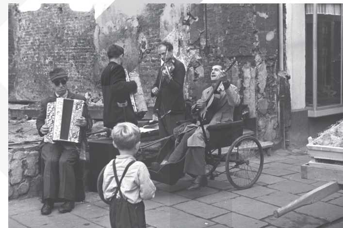
Kriegsversehrte Straßenmusiker in Düsseldorf, 29.9.1948